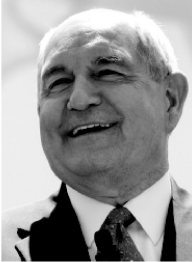
Ο Sonny Perdue, ο εν ενεργεία υπουργός Γεωργίας των ΗΠΑ.