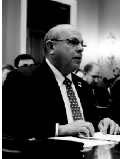
Ο Zippy Duvall, ο εν ενεργεία πρόεδρος της Αμερικανικής Ομοσπονδίας Γραφείων Αγροτικών Εκμεταλλεύσεων.

της παραγωγής και των τιμών σε συνθήκες τέλειου ανταγωνισμού. Τέλος, το Κεφάλαιο 9 έχει ως θέμα τον καθορισμό της παραγωγής και των τιμών σε συνθήκες ατελούς ανταγωνισμού.