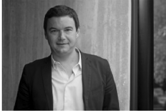
Ο Thomas Piketty, ο Γάλλος οικονομολόγος που προτείνει την αναδιανομή του πλούτου μέσα από μια παγκόσμια φορολογία.

οι αγορές σε ορισμένες περιπτώσεις είναι εντελώς ελεύθερες να καθορίσουν τις τιμές και σε κάποιες άλλες όχι. Είναι ευρέως γνωστή, για παράδειγμα, η κρατική παρέμβαση στον στίβο της αγροτικής παραγωγής. Οι εγγυήσεις δανείων προς καλλιεργητές και οι εγγυήσεις προς τους καταθέτες των πιστωτικών ιδρυμάτων αποταμιεύσεων και δανείων (savings and loan) είναι μορφές κρατικής παρέμβασης στον ιδιωτικό τομέα. Το κράτος επίσης ελέγχει πολλές πτυχές των μεταφορών, των επικοινωνιών, της εκπαίδευσης και του χρηματοοικονομικού συστήματος. Προγράμματα επισιτιστικής βοήθειας, όπως το Πρόγραμμα Χορήγησης Συμπληρωματικής Διατροφής (Supplemental Nutrition Assistance Program – SNAP) και το Ειδικό Πρόγραμμα Συμπληρωματικής Διατροφής για Γυναίκες, Βρέφη και Παιδιά (Special Supplemental Nutrition Program for Women, Infants, and Children – WIC), είναι επίσης ενδεικτικά ενός μεικτού οικονομικού συστήματος.